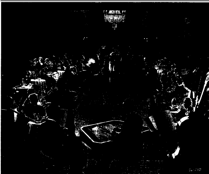
Fig. 5. Rodolfo Valentino en Los cuatro jinetes del Apocalipsis bailando tango con su amante, c. 1913.

que contrastaba con los códigos convencionales de las clases medias altas inglesas. Este conflicto de preferencias culturales se manifestó a través de una extensa correspondencia en el Times en el verano de 1913, en la cual algunos lectores acusaban al tango de ser decadente y lascivo y de promover encuentros entre "jóvenes damas" y hombres que podrían tener un "origen negroide americano o sudamericano", y otros lectores lo defendían argumentando que era artístico, un buen ejercicio y, sobre todo, moderno.