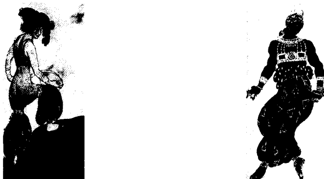
Fig. 4. El vestuario de Scherezada diseñado por Leon Bakst: la sultana azul y el esclavo dorado.

Scherezada enfatiza el deseo libidinal transgresor de las mujeres, adjudicándoles el papel de sujetos y no de objetos del deseo. Aún más, también erotizaba al hombre negro -un hecho menospreciado por los críticos de fines del siglo xx del discurso "orientalista" que han tendido a enfatizar la construcción de la mujer oriental como objeto del deseo del hombre occidental." La representación del ballet fue significativa, pues, en tanto contradice los recuentos históricos de Inglaterra en este periodo como una cultura autoréflexiva abocada a la recuperación de la tradición. Por el contrario, lo que revela es una vertiente modernizante, lista para abrazar la alteridad que se daba en tensión con las fuerzas más conservadoras. La aceptación popular de Scherezada mostró el reprimido pero poderoso atractivo de la diferencia cultural y sobre todo llamó la atención por la fascinación por lo exótico de un creciente número de mujeres inglesas de la época.