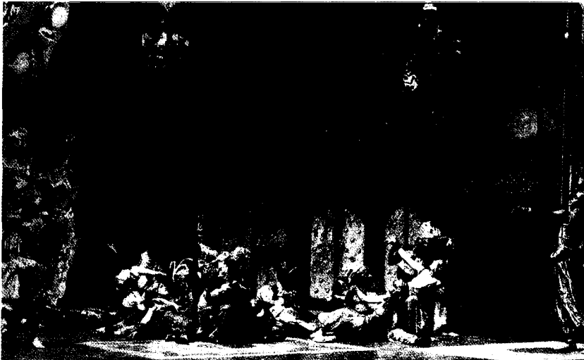
Fig. 3 Fotografía de la escena de la orgía en Scherezada , París 1910. Los bailarines en el papel de esclavos están pintados de color oscuro.

Aunque los historiadores de la danza han escrito ampliamente sobre Scherezada , la dinámica de la diferencia racial no ha sido tratada. Sin embargo, tanto en los diseños del vestuario de Leon Bakst como en las producciones originales, las mujeres persas del harem se presentaban como blancas y los esclavos como negros, perturbando seriamente las convenciones sexuales de la época (ver fig. 3, la representación de París en 1910, en la que los esclavos están pintados de negro, y la fig. 4 los diseños del vestuario de Bakst). El relato de