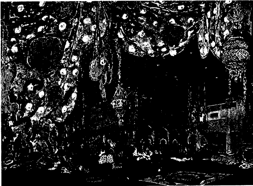
Fig. 2 La escenografía de Scherezade por Leon Bakst.

que, aunque residente en París, llegó a tener un enorme impacto en la vida cultural inglesa en los años previos y posteriores a la Primera Guerra Mundial. Con mucho la pieza más notable y sensacional de su repertorio fue Scherezada que, basado en el primer cuento de Las mil y una noches presentaba una escenografía voluptuosa (fig. 2), colores vibrantes, música modernista y coreografía teatral, intensificando la narrativa de por sí erótica y violenta. A pesar de los temores de que sería demasiado tremenda para los amantes del teatro en Londres, el ballet fue un éxito rotundo y la audiencia de la noche inaugural aplaudió durante veinte minutos. De hecho, de tal modo cautivó la imaginación que provocó una retahíla de modas: bailes, colores, estilos de vestir y decoración interior orientales se convirtieron en una "furia" entre artistas, intelectuales y las clases altas, y después fueron difundidas y popularizadas por tiendas como Selfridges que ofrecían, anunciaban, mostraban y vendían esos productos a su clientela principalmente femenina.